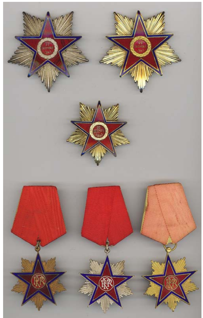
Ord. Steaua RPR, tip1 (1948)

Multe din informatiile despre variante si in special despre exemplarele din aur cu diamante au fost obtinute prin discutii cu fosti directori ai Bancii Nationale, Monetariei Nationale si alti oficiali ai guvernului communist.