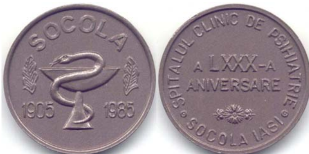
Fig.10. Medalia Spitalului Clinic de Psihiatrie Socola - 1985

Medalia (Fig.10.) are pe avers inscriptia circulara "SPITALUL CLINIC DE PSIHIATRIE SOCOLA IASI", continuata în mijloc pe doua rânduri deasupra unui motiv floral "A LXXX-A ANIVERSARE". Pe revers în zona centrala este cupa cu sarpe încolacit, flancata de doua frunze si având deasupra inscriptia "SOCOLA", continuata de o parte si de alta cu anii 1905 si 1985