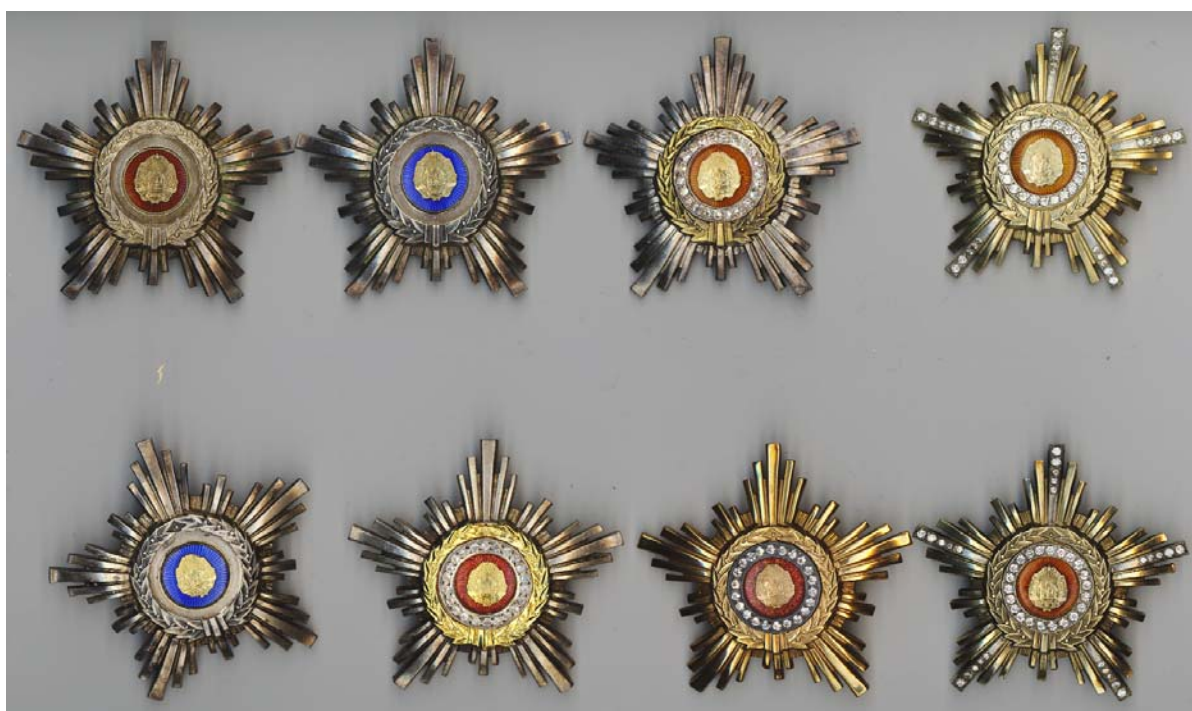
Ultimele tipuri de Steaua RPR si RSR