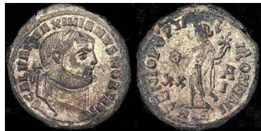
Folis Galerius Cezar

la Alexandria, în Egipt. În câmp, în dreapta lui Genius mai exista initiala "A". În acest caz, initiala "A" reprezinta numeralul grecesc "unu" si este corespunzator primului din cele cinci ateliere ale