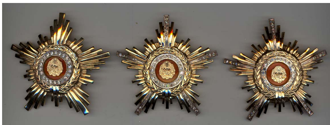
Clasa 1 din aur cu diamante