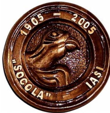
Fig.11. Medalia Spitalului Clinic de Psihiatrie Socola - 2005

Medalia (Fig.10.) are pe avers inscriptia circulara "SPITALUL CLINIC DE PSIHIATRIE SOCOLA IASI", continuata în mijloc pe doua rânduri deasupra unui motiv floral "A LXXX-A ANIVERSARE". Pe revers în zona centrala este cupa cu sarpe încolacit, flancata de doua frunze si având deasupra inscriptia "SOCOLA", continuata de o parte si de alta cu anii 1905 si 1985