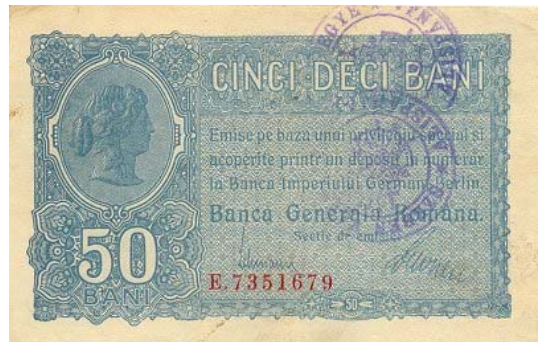
Bancnota de 50 bani Banca Generala Romana cu 2 stampile "SZE BEN VARMEGYE ALISPANJA".