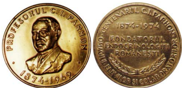
Fig.5. Medalia Acad. Prof. Dr. C.I. Parhon - 1974

Marelui savant i-au fost dedicate doua medalii. Prima, realizata de catre elevii si colaboratorii sai, cu ocazia împlinirii venerabilei vârste de 75 de ani, dar si a 50 de ani de activitate stiintifica. Medalia este din bronz, cu diametrul de 60 mm., pe avers fiind reprezentat bustul profesorului vazut din profil spre dreapta, cu inscriptia circulara: "ACADEMICIAN PROFESOR DR. C.I. PARHON 1949"; iar pe revers dedicatia pe opt rânduri: "TOVARASULUI / SI / MAESTRULUI NOSTRU / ÎNTEMEIETORUL ENDO- / CRINOLOGIEI ROMÂNESTI / OMAGIUL ELEVILOR SAI / LA 50 ANI DE ACTIVI- / TATE STIINTIFICA" (Fig.4).