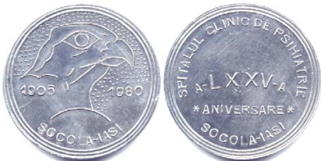
Fig.8. Medalia Spitalului Clinic de Psihiatrie Socola - 1980

circulara "SPITALUL CLINIC DE PSIHIATRIE SOCOLA IASI", iar dedesubt, orizontal pe doua rânduri "a-LXXV-a / ANIVERSARE". Prezenta capului de vultur pe aversul medaliei nu tine de simbolistica medicala, ci ilustreaza cuvântul slavon "SOCOL" care în traducere înseamna vultur si, prin extensie, numeste un loc dominat de vegetatie în care traiesc vulturi si care este prielnic pentru nevoia oamenilor de liniste, dupa cum aprecia domnul profesor A. Cumpatescu .