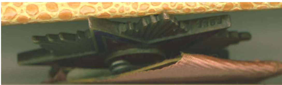
Numar de serie pe unul din primele tipuri