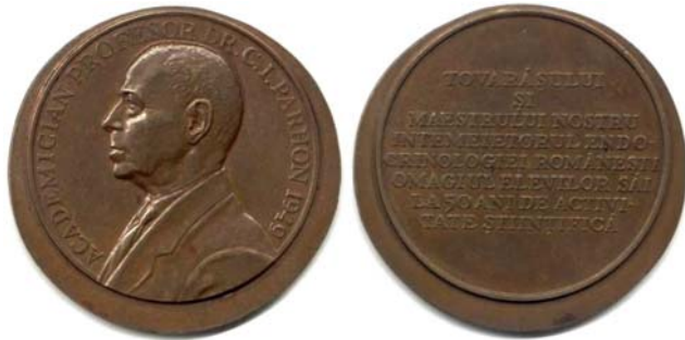
Fig.4. Medalia Acad. Prof. Dr. C.I. Parhon - 1949

În 1933 profesorul Parhon paraseste definitiv Iasul pentru a înfiinta, un an mai târziu, în cadrul Universitatii de Medicina din Bucuresti prima Catedra de Endocrinologie din lume.