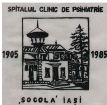
Fig.9. Placheta Spitalului Clinic de Psihiatrie Socola - 1985

Cu ocazia jubileului de 80 de ani, în 1985, se realizeaza o placheta precum si o noua medalie. Placheta din bronz, realizata prin electroeroziune, cu dimensiunile de 83,0 x 85,0 mm., (Fig.9.) are în zona centrala un medalion cu imaginea pavilionului principal, pavilion ce poarta numele doctorului Alexandru Braescu, încadrat de inscriptia "SPITALUL CLINIC DE PSIHIATRIE", sus, "SOCOLA IASI", jos, si anii "1905 / 1985", lateral, de o parte si de alta.