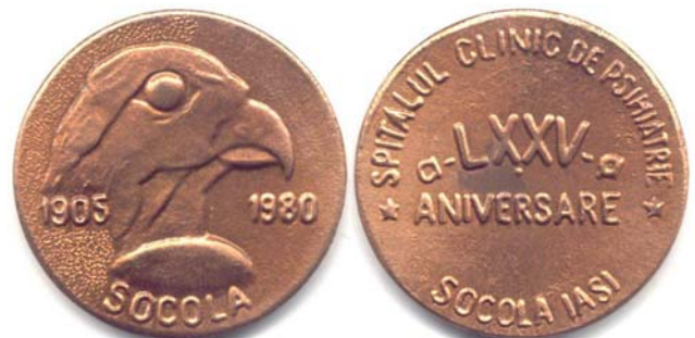
Fig.7. Medalia Spitalului Clinic de Psihiatrie Socola - 1980

Prima piesa cu caracter numismatic dedicata Spitalului Socola este insigna jubileului de 50 ani (Fig.6). Fabricata din bronz emailat, de aproximativ 25 x 21 mm., reprezinta: pe o banda ovala cu email rosu, dispusa vertical, este asezata transversal în partea de jos o carte deschisa, emailata în alb, cu anii "1905 / 1955". Pe banda ovala este legenda "SPITALUL DE NEUROPSIHIATRIE SOCOLA IASI". În partea de jos a insignei este reprezentat un ornament alcatuit din frunze de stejar prinse jos cu panglica rosie. În mijloc, deasupra cartii, este cupa cu sarpe încolacit având, de o parte si de alta, inscriptia "50 ANI DE / ACTIVITATE".