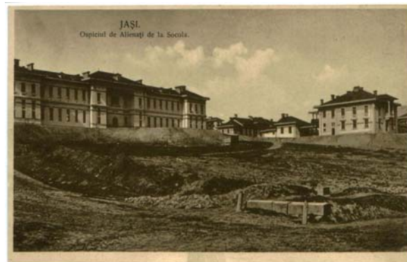
Fig.2. Carte postala ilustrata - Ospiciul de Alienati de la Socola. Iasi.1915, Editura Libraria Romaneasca si Depozit de Ziare, J.V. Jonescu, Iasi

Din aceleași considerente, la inițiativa profesorului Alexandru Obregia, la un an după inaugurarea Spitalului Socola din Iași, în 1906 începe construirea Spitalului Central de Neuropsihiatrie din București. Din 1905 și până la sfârșitul vieții doctorul