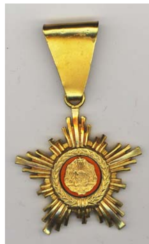
Ord. Steaua RSR, vers. diplomatica

O asemenea revista nu exista si pentru ca multi au asteptat ca altii sa o faca. Noi ne-am saturat sa asteptam, asa ca am facut-o chiar noi. Vom incerca sa avem materiale din cat mai multe domenii. De aceea va rugam pe voi, cititorii acestei reviste, sa ne trimiteti orice articol despre monede, bancnote, decoratii, timbre, actiuni, jetoane, insigne, uniforme sau orice alt domeniu.